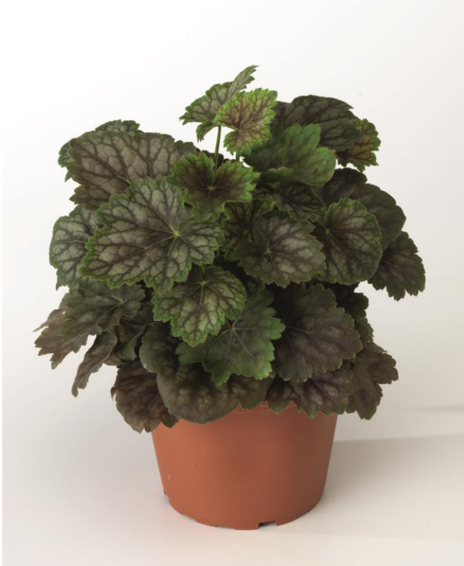
Marvelous Marble SY1908