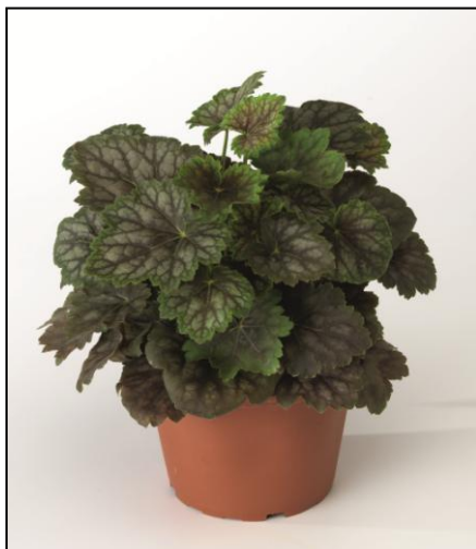
Marvelous Marble SY1908