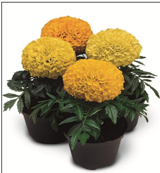
Mix SY1478, SY1479