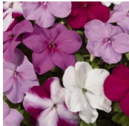
Strawberry Butterfly N6791