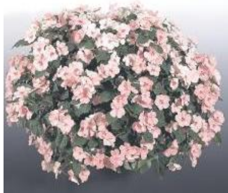
Coral Bee N6592