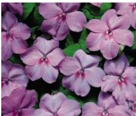
Blue Satin N6531

V nabídce v 15 čistých barvách a 7 směsích.