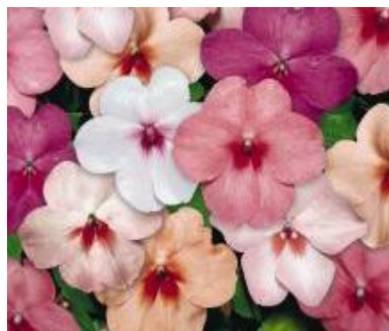
Butterfly Mix N6832