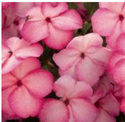
Pink Frost N6731