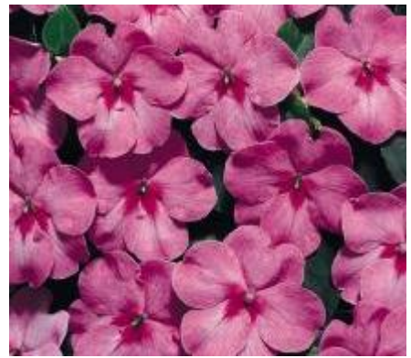
Deep Pink N6621