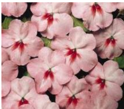
Cherry Butterfly N6571