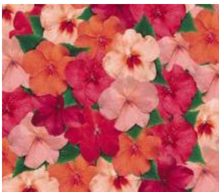
Cancun Mix N6833