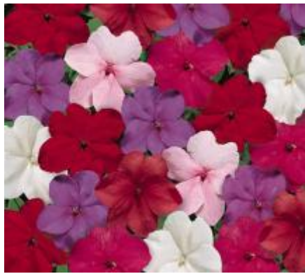
Crystal Mix N6834