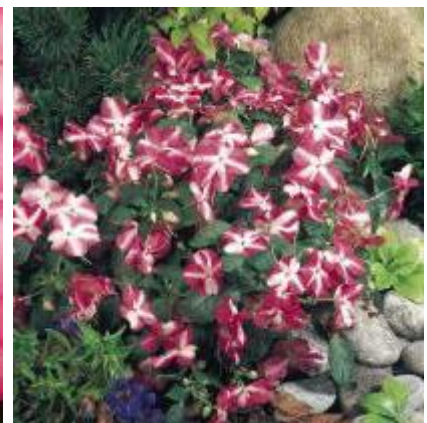
Rose Star N6772