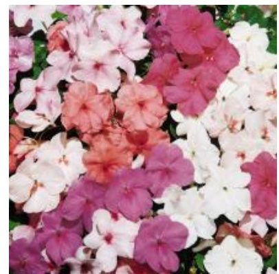
Pastel Mix N6836