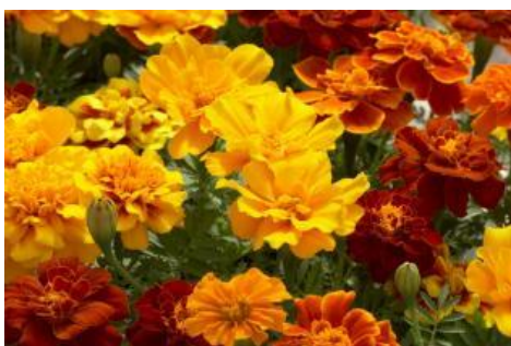
Mix W3411 / D / C

Veškeré informace uvedené v kultivačních kartách jsou pouze informační a je nutné je upravit podle konkrétních podmínek pěstování.