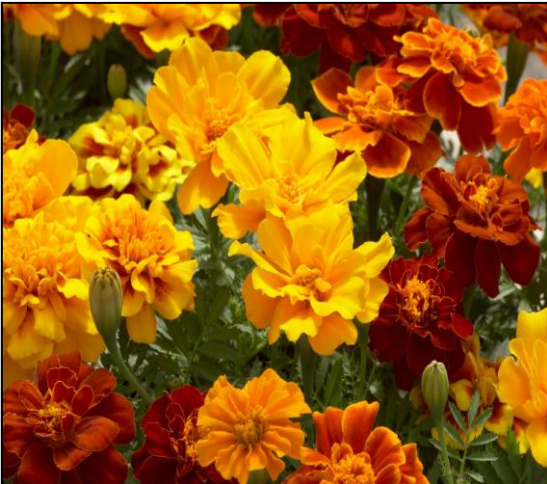
Mix W3411 / D / C