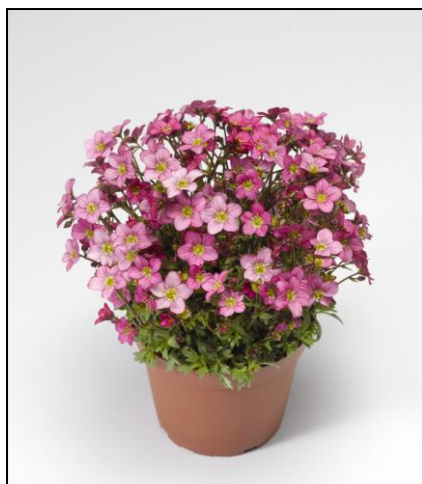
Red SY1957, SY1958