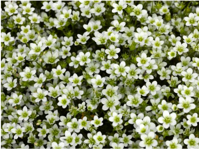
White Red SY1961, SY1962