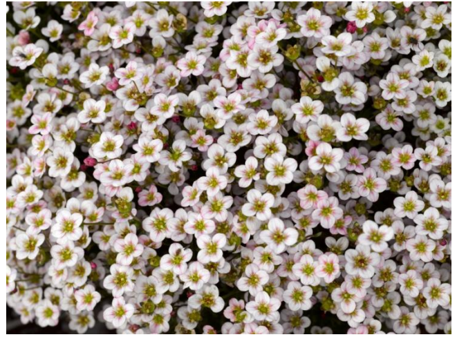
Rose Shades SY1959, SY1960