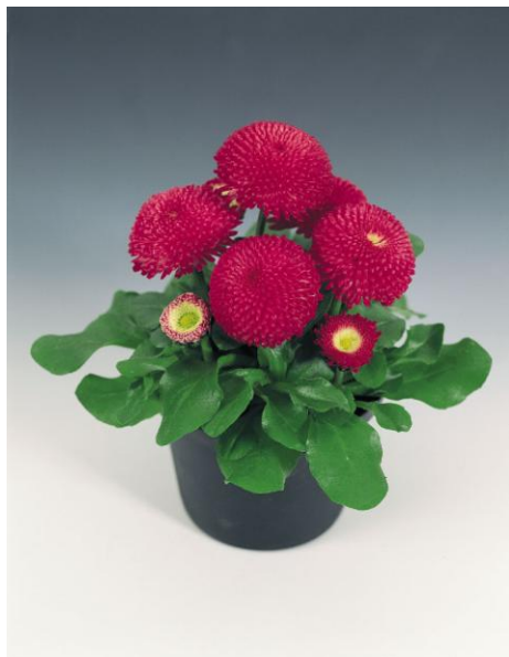
Deep Rose S2590 / P

V nabídce 5 čistých barev a směs (D2670 / P).