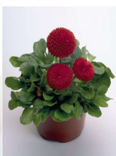
Red D2640 / P