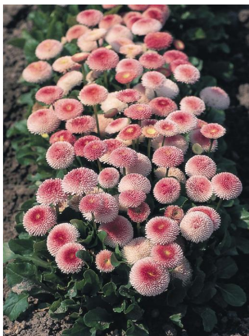
Strawberries & Cream D2600 / P