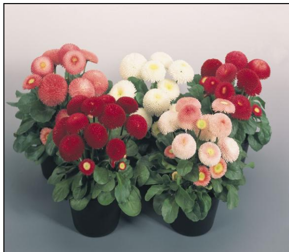
Mix D2670 / P