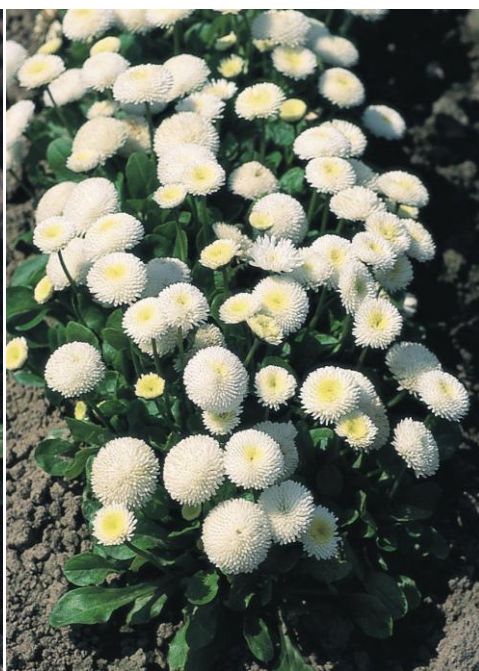
White D2650 / P