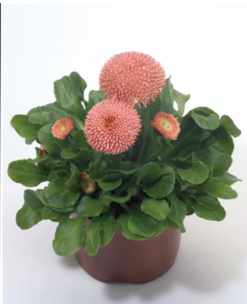
Pink D2630 / P