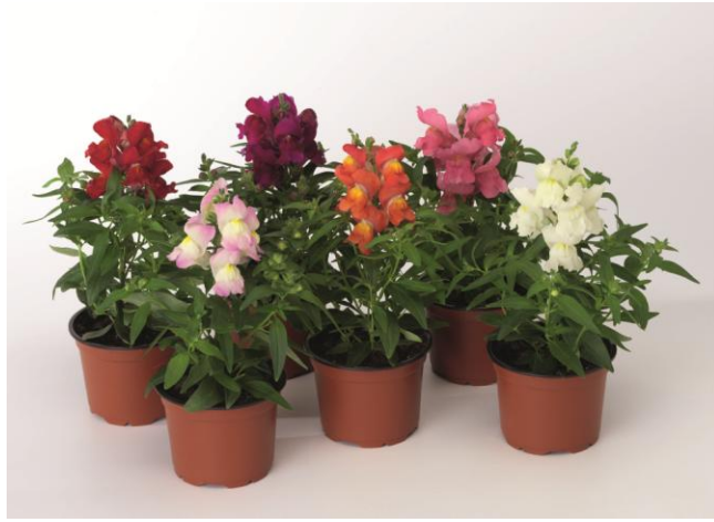
Formula Mix SY1002