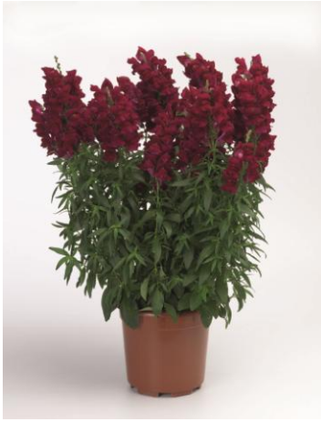
Deep Red SY1001