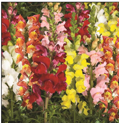
Formula Mix SY1002